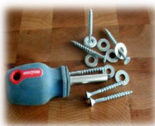
Vis No. 8 et rondelle 1/2"