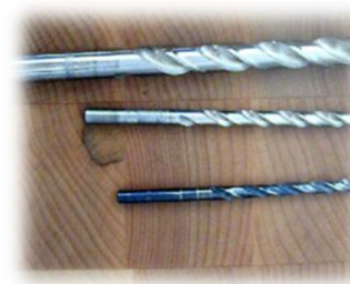
Foret de 1/4", 1/8" et 3/16"